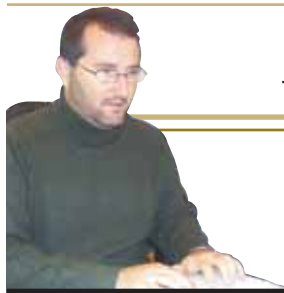
EDUCADEMIA DOS HERMANAS Avda. Ramón y Cajal, s/n. Tel.: 954 720 668 • 660 124 865