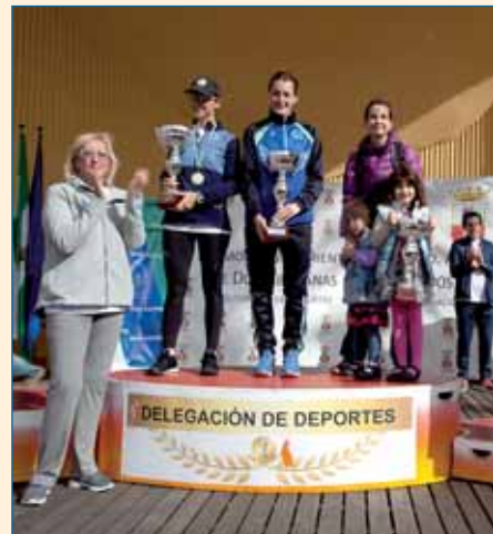
Podio general femenino.