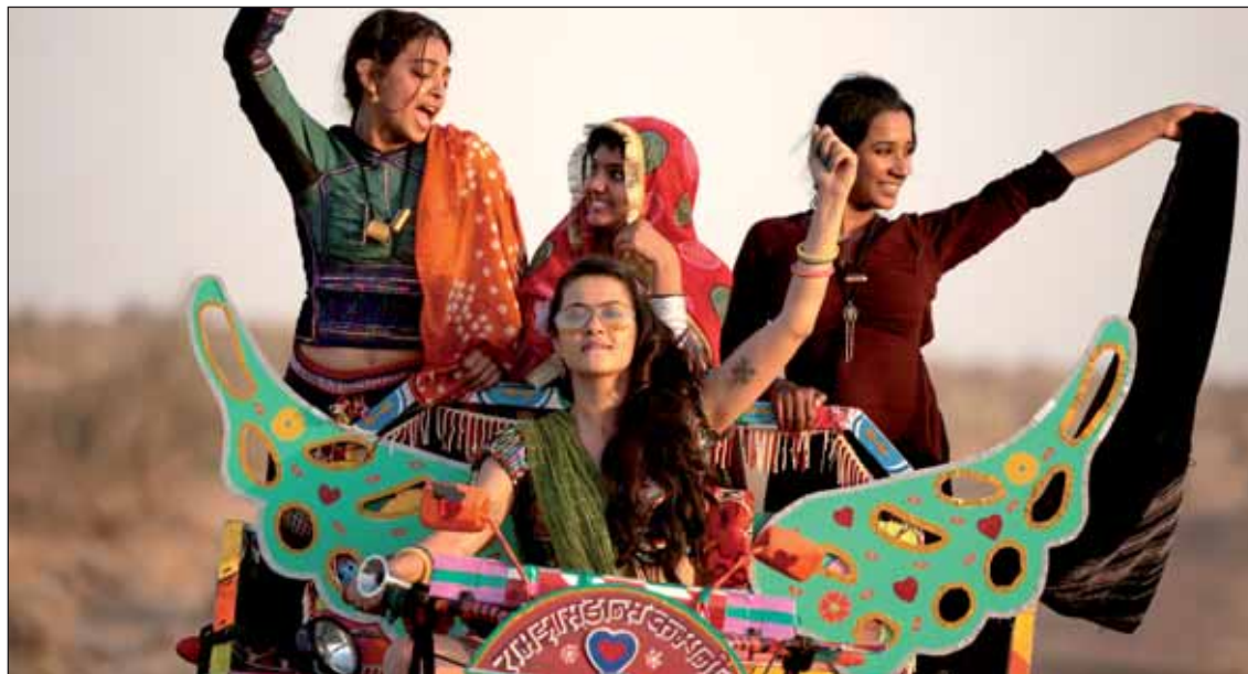
El lunes comienza la XIV Muestra de Cine 'Con nombre de Mujer'

lla), se darán cita en esta competición para las categorías benjamín, alevín, infantil y absoluta, en los estilos libre, espalda, braza y mariposa.