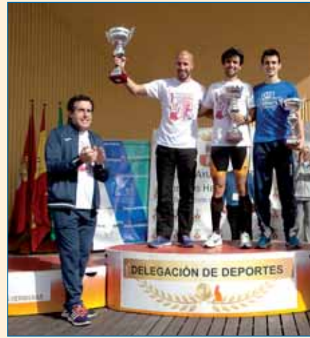
Podio general masculino.

Desde la Delegación de Deportes se quiere agradecer la colaboración ofrecida por la delegación de Igualdad, la Policía Local, Protección Civil, a los voluntarios y voluntarias de los ciclos formativos de grado superior del I.E.S Virgen de Valme, y del Club de Natación Dos Hermanas, y por supuesto a las Asociaciones de Mujeres: Feministas Hypatia, Agrupación Literaria María Muñoz Crespillo, Artesanas Nazarenas ASMUADHER, Grupo de Teatro Piruetas y 5 de Abril.