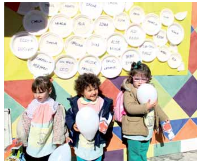
La Escuela Infantil Mi Cole celebró el Día de la Paz con sus niños realizando una gran paloma con platos con sus nombres y manitas. Todos salieron al patio con un globo blanco cantando canciones del Día de la Paz.