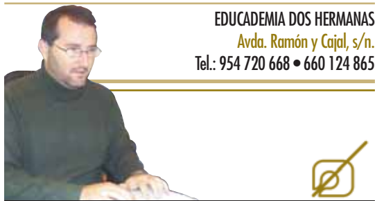
EDUCADEMIA DOS HERMANAS Avda. Ramón y Cajal, s/n. Tel.: 954 720 668 • 660 124 865