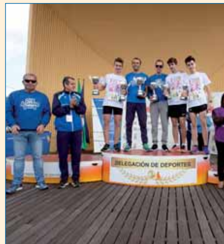
Podio general por parejas.