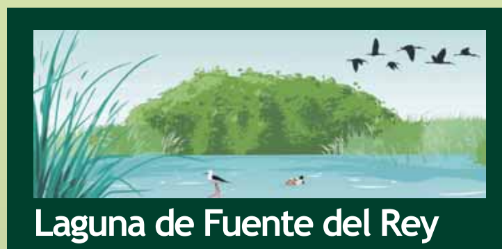
Laguna de Fuente del Rey

Se ha replantado una nueva partida de olivos procedentes de la parcela en la que se está construyendo el futuro Palacio de Exposiciones y Congresos de la ciudad. Concretamente, se han sembrado en la nueva glorieta de Los Cipreses y en la parcela situada frente al tanatorio municipal.