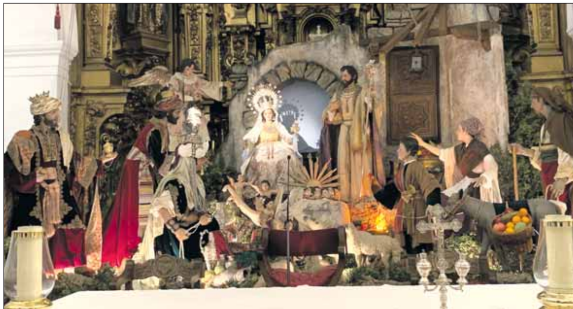
Ya se puede visitar el Belén Monumental en la parroquia Santa María Magdalena.

bajado a casi los 100. Pese a estas cifras alentadoras, desde el Consistorio se hace un llamamiento para no bajar la guardia.