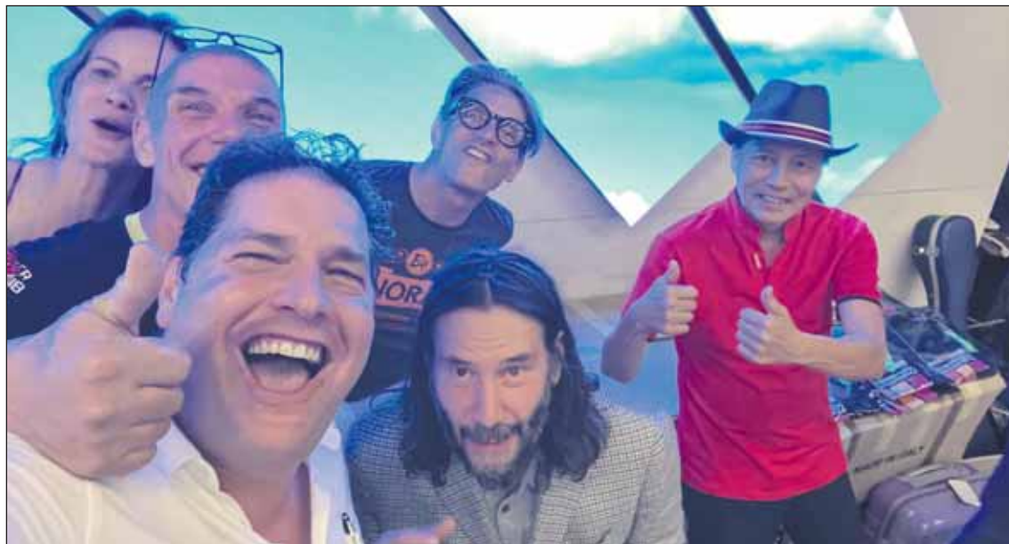
El actor Keanu Reeves estuvo el viernes en la ciudad cenando en Los Baltazares.