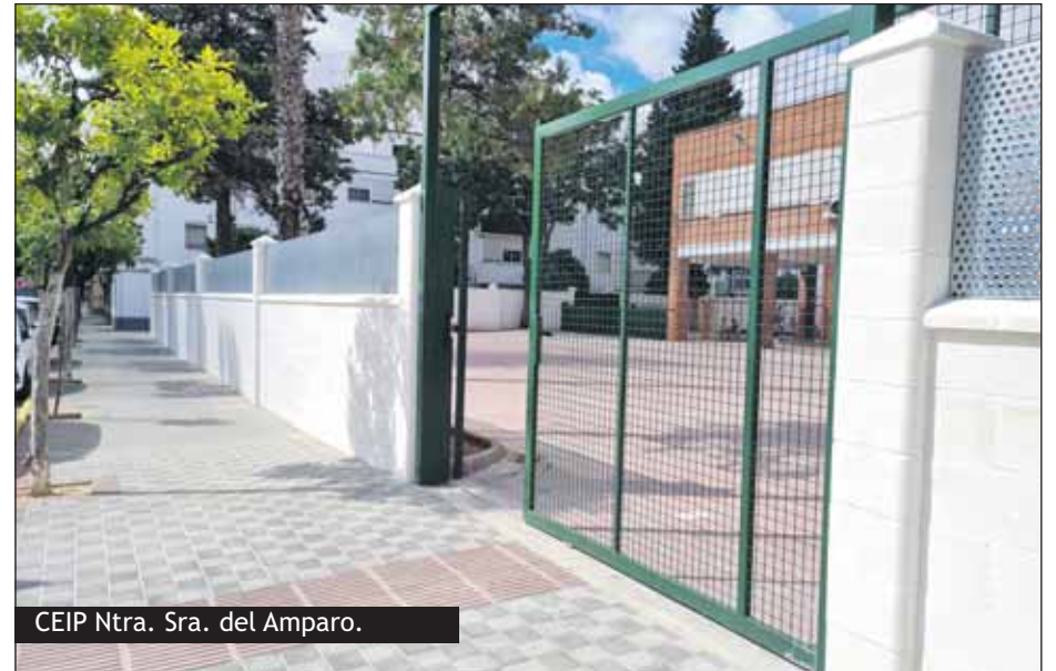
CEIP Ntra. Sra. del Amparo.

sus dificultades del lenguaje, siendo cada vez más frecuente esta dificultad entre los infantes.