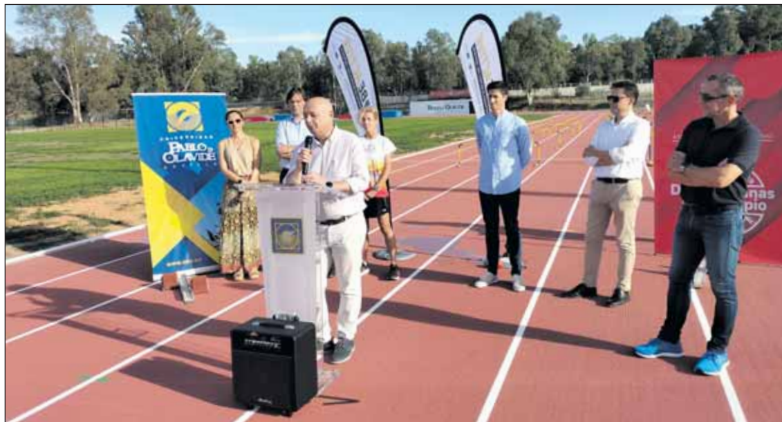
Terminan las obras de la pista de atletismo en la Universidad Pablo de Olavide.

riada programación. Se darán cita más de una docena de Foodtrucks con diversas opciones gastronómicas de diferentes países.