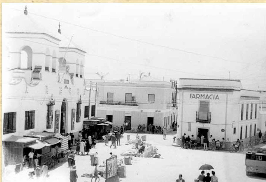
A la izquierda, Plaza de Cruz Conde (actual Plaza del Emigrante) en los años 60. Se aprecian, a la puerta de la plaza, los dos kioscos de chucherías de Pepe y, al otro lado de la puerta, los dos puestos de churros.