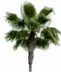
Palmera de California