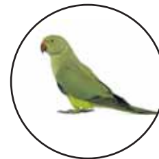
Cotorra de Kramer