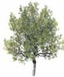
Plátano de Sombra

Dos Hermanas tiene parques y jardines con ejemplares de árboles y arbustos muy valiosos, tanto por su antigüedad, rareza y cualidades estéticas, como por su valor histórico. Además cuenta con actividades y servicios que te harán disfrutarlos aún más. ¡Vívelos!