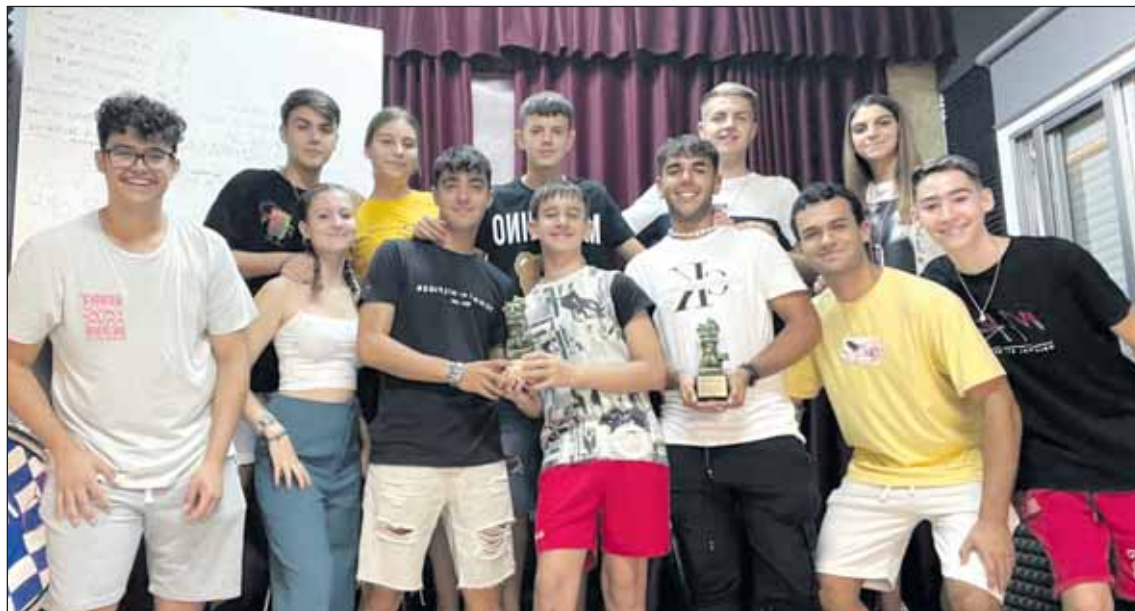
Dos premios 'Lo mejó de lo mejón' para la chirigota juvenil del CCC Ibarburu.

Gran Poder, Cachorro, Macarena, Esperanza de Triana, Virgen de los Reyes, Consolación de Utrera y Nuestra Señora de Setefilla de Lora del Río.