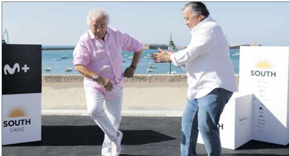
Los del Río participarán en el III Concierto Solidario de Acaye, este sábado.

en las que se podrá participar de manera gratuita. Juegos, scape room, talleres, manualidades... permitirán pasar una entretenida mañana.