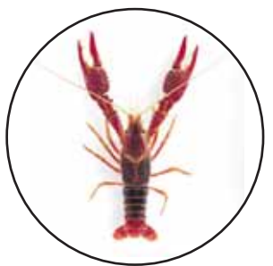
Cangrejo de Río Americano