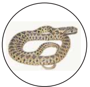
Culebra de Herradura