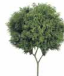
Acacia de Tres Espinas