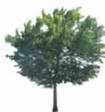
Olmo de Siberia