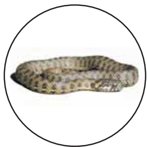
Culebra de Agua