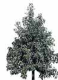
El Árbol Botella