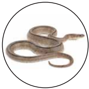
Culebra de Escalera