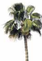
Palmera de California