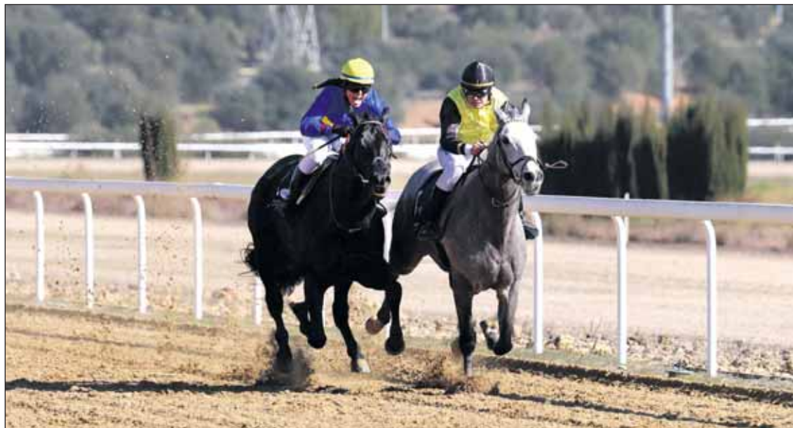
El domingo, segunda jornada de carreras en el Hipódromo con entrada gratuita.