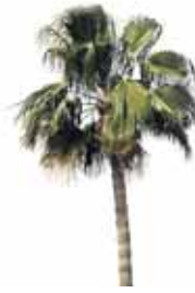
Palmera de California

Dos Hermanas tiene parques y jardines con ejemplares de árboles y arbustos muy valiosos, tanto por su antigüedad, rareza y cualidades estéticas, como por su valor histórico. Además cuenta con actividades y servicios que te harán disfrutarlos aún más. ¡Vívelos!