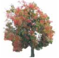
Árbol del Fuego