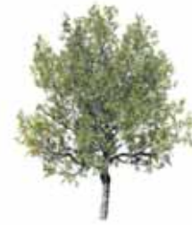
Plátano de Sombra