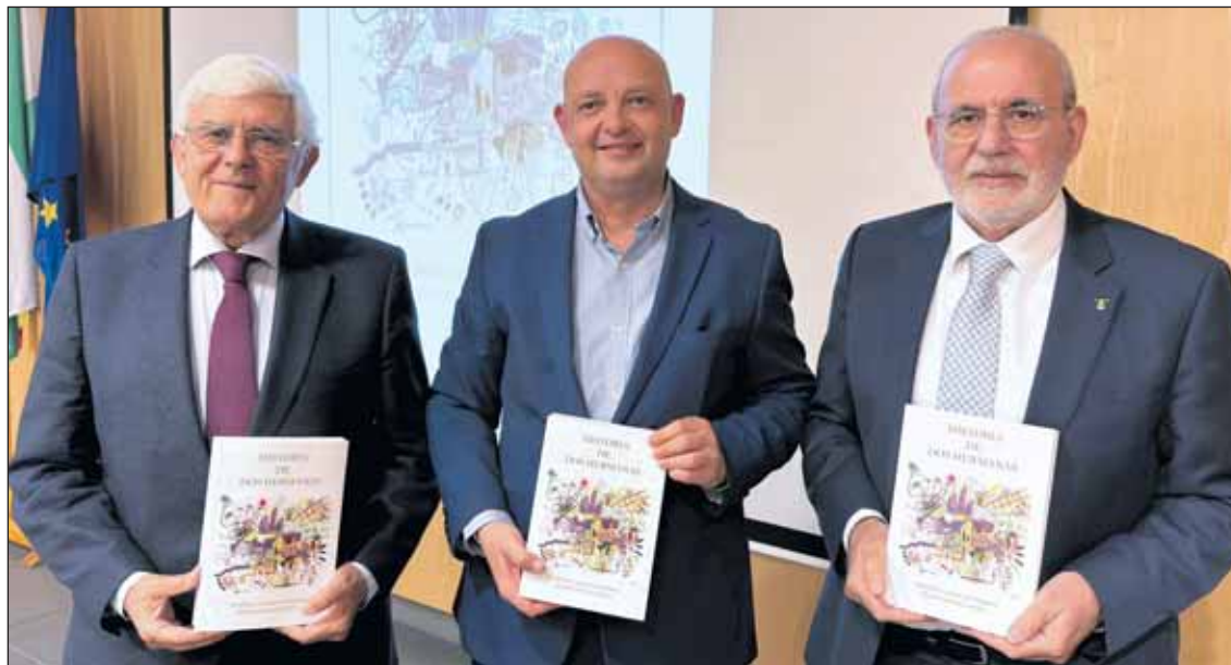
El CC La Almona acogió anoche la presentación del libro 'Historia de Dos Hermanas'.

en tu barrio con actuaciones y fiestas gastronómicas en las sedes vecinales y centros sociales. La Gran Cabalgata de Carnaval será el día 10.