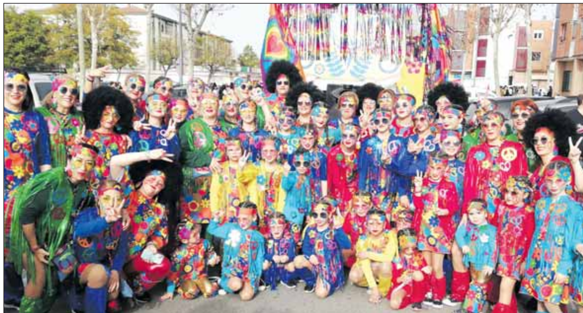
La Gran Cabalgata de Carnaval recorrerá el sábado el centro de la ciudad.

hípicas albergarán el Campeonato de Andalucía 2024 de Cortadores de Jamón Profesionales a beneficio de Aspace.