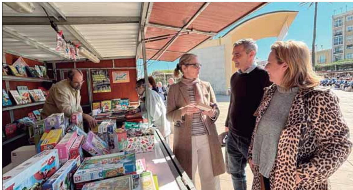
La plaza del Arenal acoge la Feria del Libro hasta el próximo domingo.

horas, se convoca una concentración en la plaza de la Constitución y el domingo, a las 10 horas, hay una marcha y carrera por la igualdad.