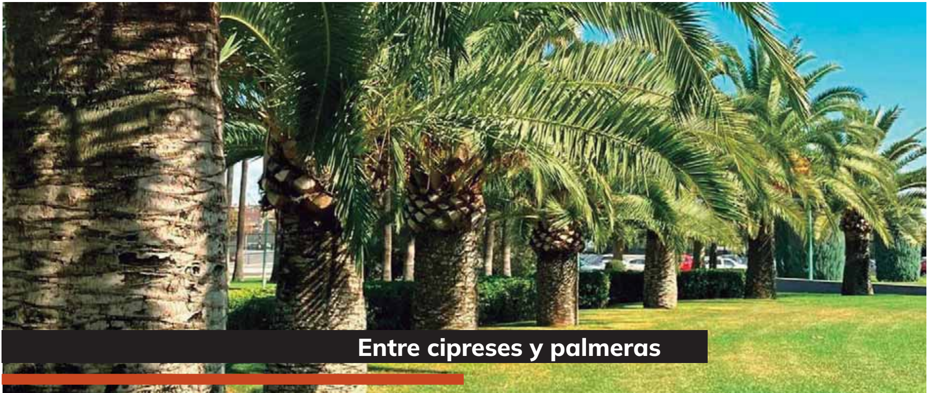
Entre cipreses y palmeras