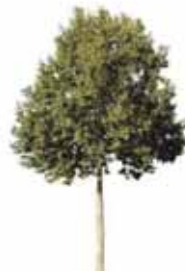
Plátano de Sombra