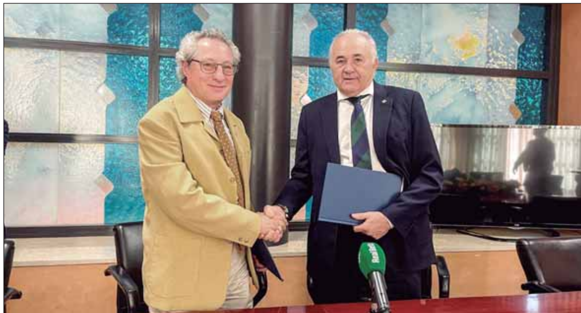
Convenio de cooperación entre el Ayuntamiento y la Fundación Real Betis Balompié.

Entre las principales novedades se encuentran el estreno de la Agrupación Musical Ntro. Padre Jesús Cautivo y la Imagen de Santa María Magdalena.