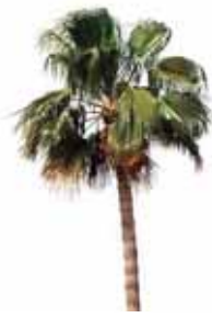
Palmera de California