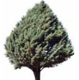
Ciprés de Arizona

Dos Hermanas tiene parques y jardines con ejemplares de árboles y arbustos muy valiosos, tanto por su antigüedad, rareza y cualidades estéticas, como por su valor histórico. Además cuenta con actividades y servicios que te harán disfrutarlos aún más. ¡Vívelos!