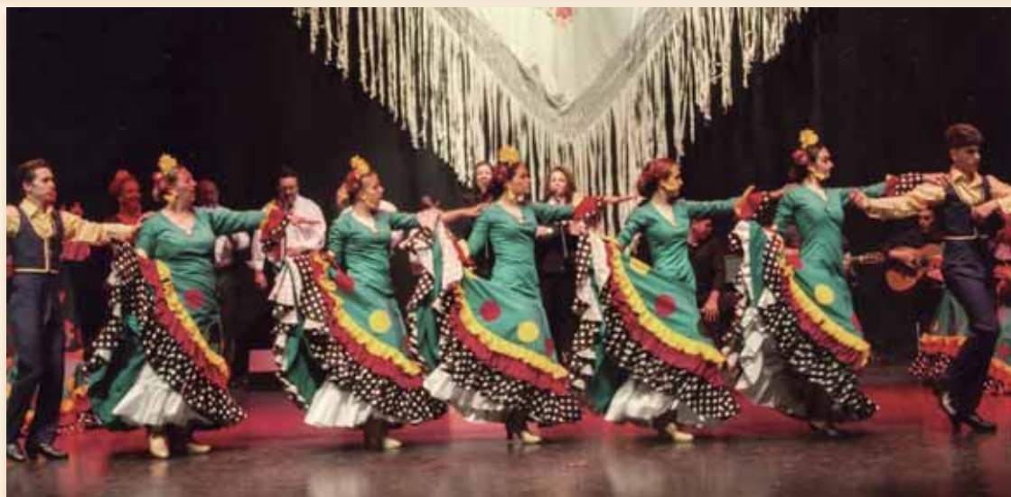
16-3-2019. Espectáculo "Al compás del tiempo", que conmemoraba en el Teatro Municipal el 40 aniversario de la Academia de Pepi Vaquero.