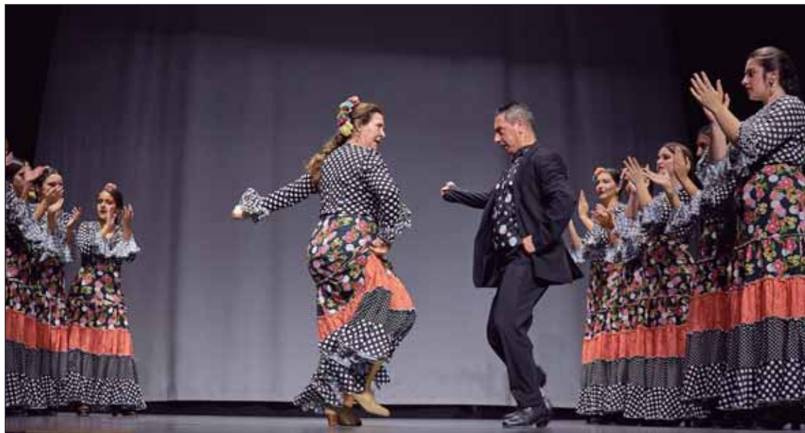
El XXI Festival de Academias de Baile se celebra este fin de semana en el Teatro.

tributo a iconos de la música nacional e internacional y actividades infantiles para los más peques. La entrada es gratuita.